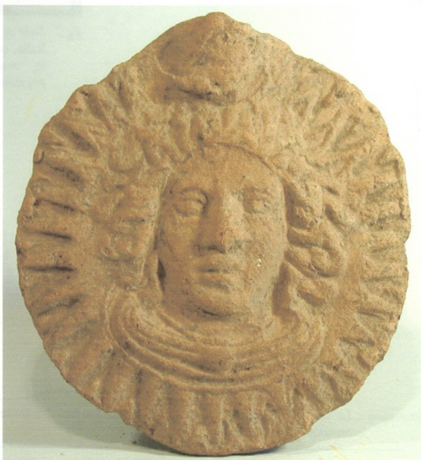
fig.1 Dea "Giovia" di Capua (dimensioni reali).

La resa stilistica dell'immagine della Dea appare di particolare risalto plastico, con una brillante soluzione dei problemi posti dalla realizzazione di una immagine frontale. Il volto è pieno, carnoso, con grandi occhi spalancati, palpebre rilevate, labbra semiaperte, naso pesante, collo massiccio, con una preponderanza, nei