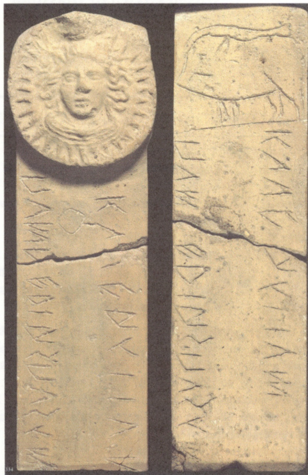
fig.2 Stele di fig.334, da - Le religioni degli italici , in Italia, omnium terrarum parens - realizzata con la medesima matrice del disco fittile presentato.

Per un'approfondimento bibliografico si rimanda alla trattazione di A. Prosdocimi, Le religioni degli italici , in Italia, omnium terrarum parens , Milano 1989, pp.477-545. In particolare si segnala la fig.334, con la stele realizzata con la medesima matrice, e le pp.537-539, relative alle "iovile (diovile) capuane". Per le stele cfr. A. Franchi De Bellis, Le iovile capuane , Firenze 1981 (abbreviato FDB)