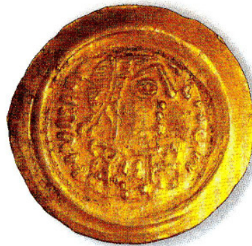
Tremisse n° 12: a nome dei Duchi(?) con il monetiere Marinus

Nel Nord, con Perctarit, si ha poi il primo tentativo di porre il monogramma reale sulla moneta d'argento, ed il monetiere Marinus pone il proprio nome sulle monete auree (vedi moneta n° 12).