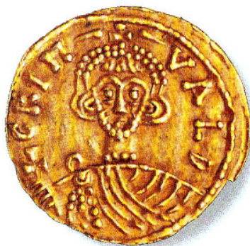
Tremisse n° 33: Grimoaldo III e Carlo Magno

di Carlo Magno, nel 792, si propone come principe. La monetazione del Ducato di Benevento fa storia a