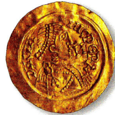
Tremisse n° 14: Cunincpert

Viene proposta una moneta completamente nuova, di peso pieno e di oro puro, con il ritratto ed il nome del re al dritto, ed il tipo "nazionale" del S. Michele in abito militare al rovescio in precisa contrapposizione ai contemporanei tipi bizantini (vedi monete n° 14 e n° 15). Questa tipologia continua ancora, nel Nord nella pri-