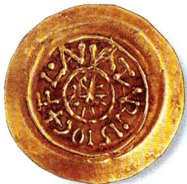
Tremisse n° 32: Desiderio

Si tratta, sempre, di tremissi prodotti con tecnica e