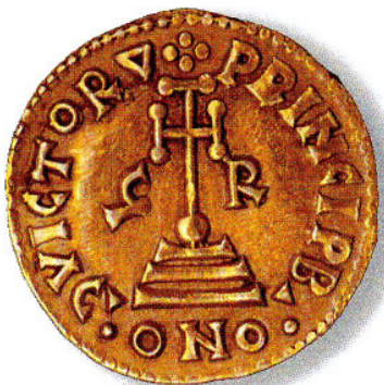
Solido n° 34: Grimoaldo III

sé, perché denuncia la collocazione intermedia del principato tra mondo carolingio e bizantino, tra l'area di circolazione dell'oro e quella dell'argento