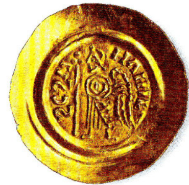
Tremisse n° 20: Liutprando

Situazione, questa, nella quale va letta, forse l'atti-